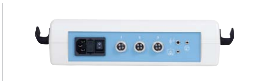
3- gniazdowy - Terapus 2

Podstawą nowej rodziny laserów są 3 typy sterowników, do których można podłączać dowolnie wybrane (z małymi wyjątkami) sondy: