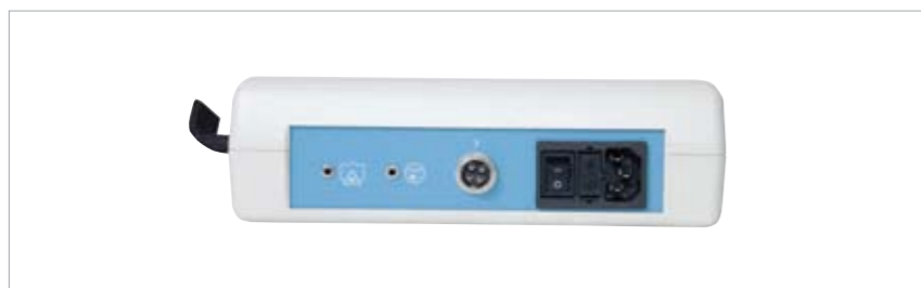
1- gniazdowy - Terapus 2 micro

Gniazda przyłączeniowe w sterownikach są uniwersalne, tzn. rozpoznają i obsługują różne typy sond z nowej oferty Accuro. W danej chwili, na stałe, do sterownika może być podłączona („przypięta”) ilość sond, określona liczbą gniazd. Możliwe jest jednak posiadanie oprócz sterownika, dowolnej ilości aplikatorów laserowych, o zróżnicowanym charakterze, mocy i długości fali.