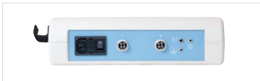
2- gniazdowy - specjalny, tzw. skanerowy - Terapus 2 scan